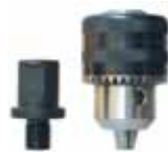
Адаптер та 13 мм патрон

Революція в економії часу. Спеціальний патрон встановлюється на якір, що дозволяє за декілька секунд змінювати інструменти.